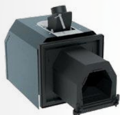
Horák na pelety FIREBLAST s automatickým čistením