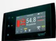
Dotykový regulátor kotla ESTYMA TOUCH v štandarde